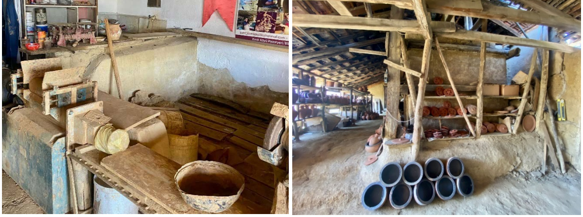
Fotoğraf 5 ve 6. Kadir Yaşar'dan Devralındığı Şekliyle Kullanılan Çömlek Atölyesi

Salim Yaşar, hâlen babasından devraldığı çömlek atölyesini işletmektedir. Fiziki açıdan bakım ve onarıma ihtiyaç duyan bu atölyeye, babasından sonra hiçbir ekleme ya da çıkarma yapmadığını belirten Yaşar, her köşede babasının anıları olduğu gerekçesiyle atölyeyi restore ettirmek istememektedir.