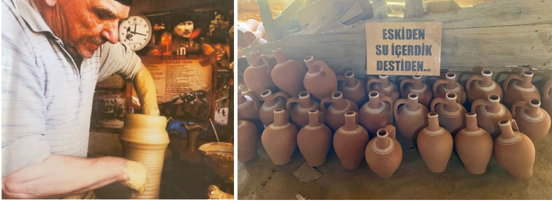
Fotoğraf 9 ve 10. Çömlek Yapımı ve Sanatkârın Emeği Neticesinde Ortaya Çıkan Ürünler

özgü üslubuyla ürettiği akvaryum malzemeleri, darbukalar, düdüklü tencereler, bal küpleri, vazolar, çaydanlıklar, mumluklar, kumbaralar, kahve fincan takımları, cezveler gibi çömlek çeşitleri, çömleğin daha geniş bir kitleye hitap etmesini sağlamıştır. Yaşar, 2000-2002 yılları arasında haftada bir gün İzmir'e, bir gün İstanbul'a giderek toptancı dükkânlara ve büyük alışveriş merkezlerine atölyesinde imal ettiği çömlek çeşitlerini pazarlamıştır. Çömleğe talep artınca Kınık'taki atölye sayısında da artış olmuştur.